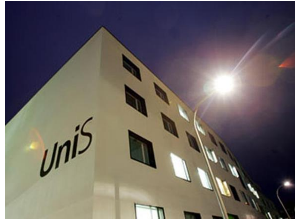
Hauptgebäude (Innenräumlichkeiten) und UniS